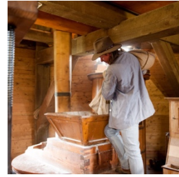
Bilder Homepage Hessenpark

Zunächst aber standen erst einmal die Einkäufe verschiedener Spezialitäten und eine kräftige Stärkung am frühen Morgen mit Fischbrötchen oder einer Bratwurst am Bauernmarkt auf dem Plan. So gestärkt konnte man nun mit der Besichtigung der historischen Gebäude und den einzelnen Handwerksvorführungen beginnen.