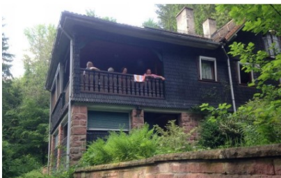
Single-Freizeit im Forsthaus Mai 2016