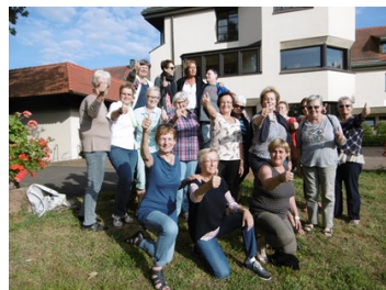
Frauen-Wochenendseminar Juli 2016