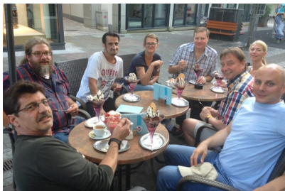
Junger Kreuzbund-Juliseminar 2016