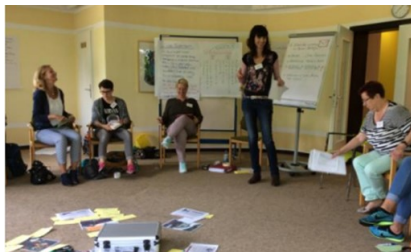
Seminar „Spätes Trauma“ - Kinder suchtkranker Eltern Juni 2016