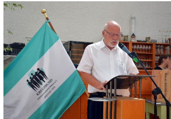
Kuratoriumsvorsitzender und Stellvertreter