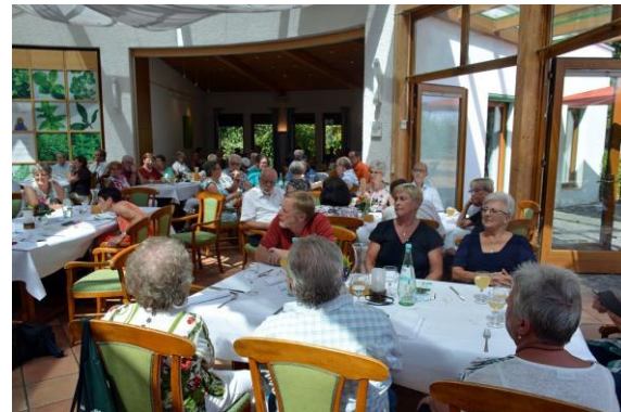
Autor: Hartmut Zielke